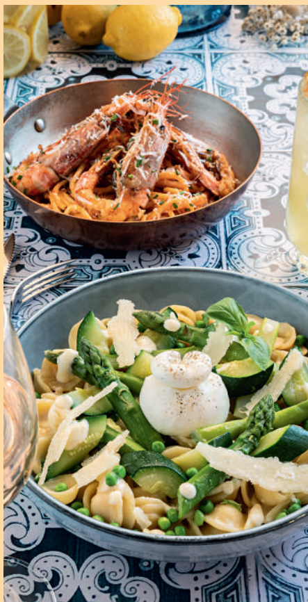
Orecchiette Primavera / Spaghetti alla Diavola