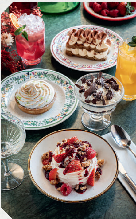
Frutti Volfoni / Mousse Stracciatella / Tarte au citron meringuée / Tiramisù