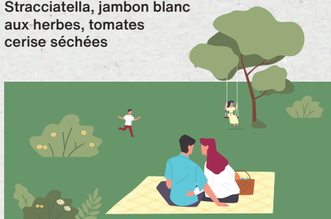
Verdure / Prosciutto & Stracciatella