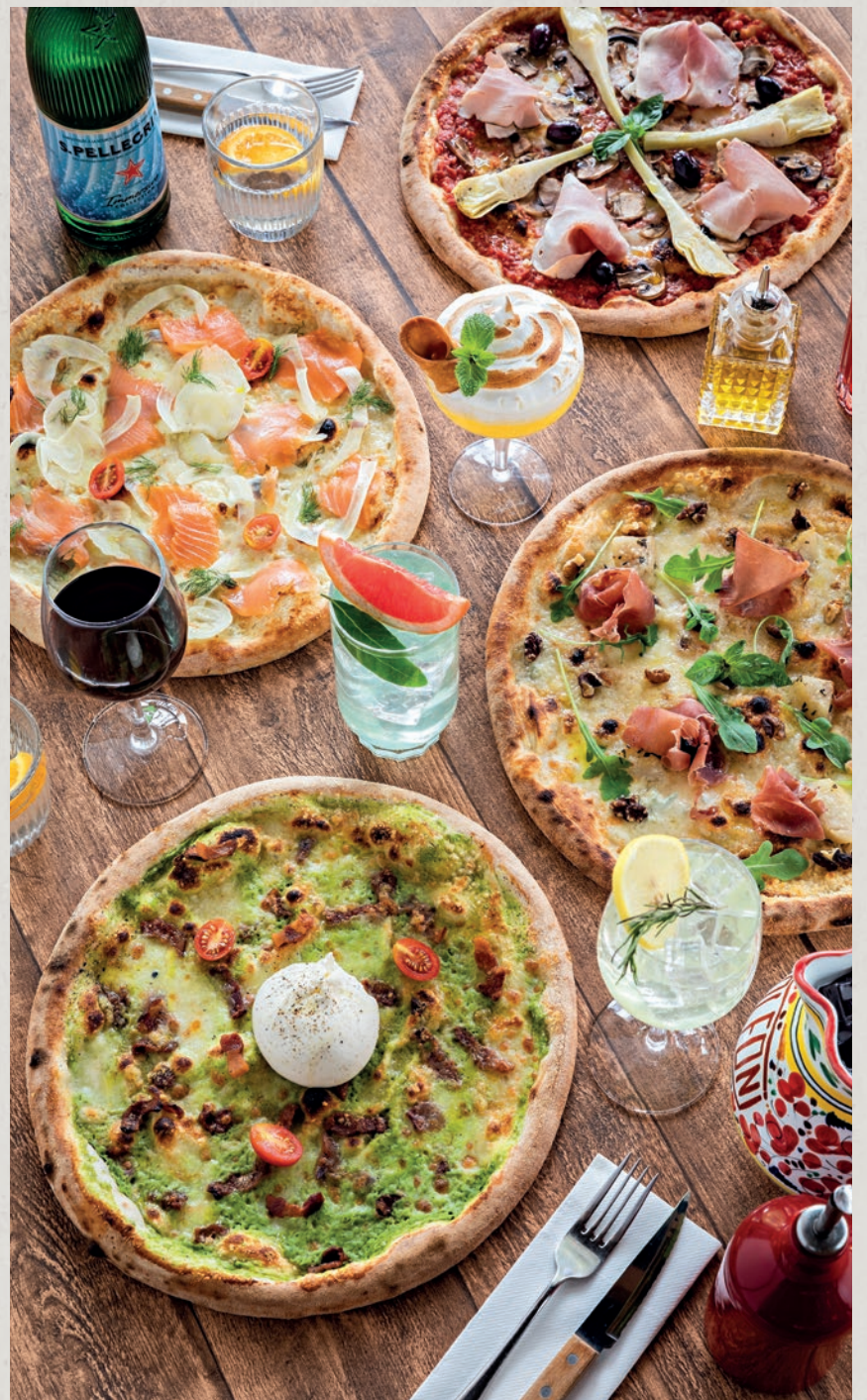
Capricciosa / Salmone / Gorgonzola & speck / Bella Verde