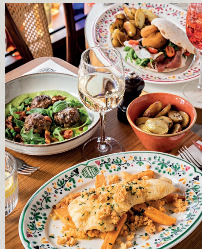
Puccia di Parma / Polpette Primavera / Églectin & patate douce