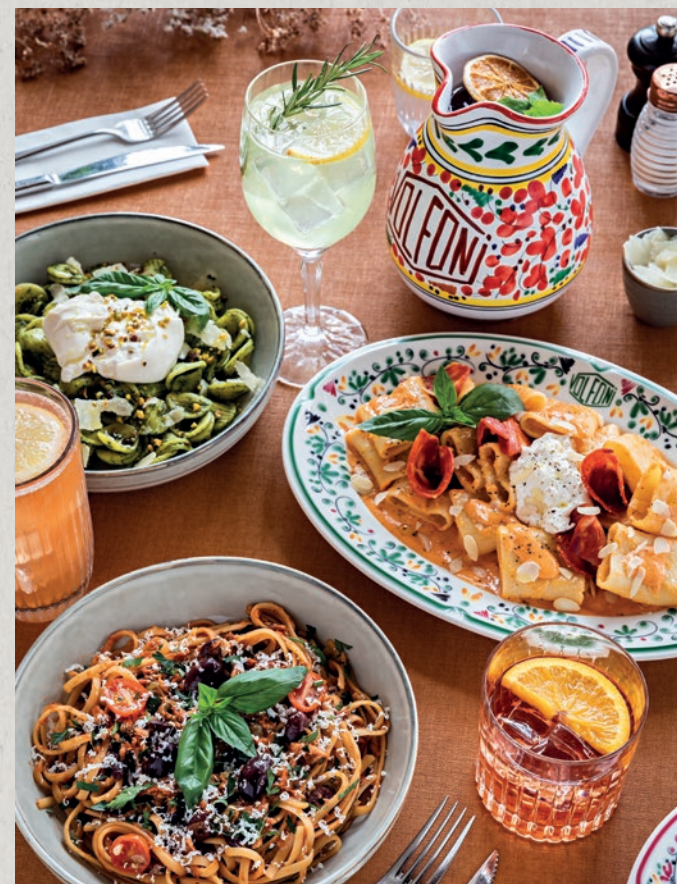
Burrata & Pistacchio / Paccheri Gorgonzola & spianata / Linguine alla puttanesca