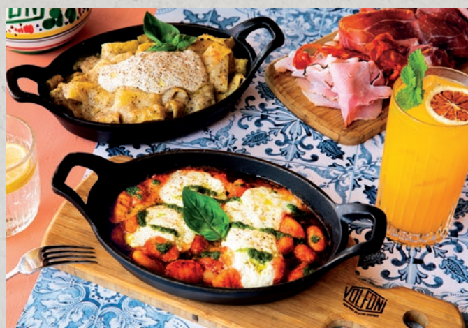
Gnocchi alla sorrentina / Gratin al tartufo