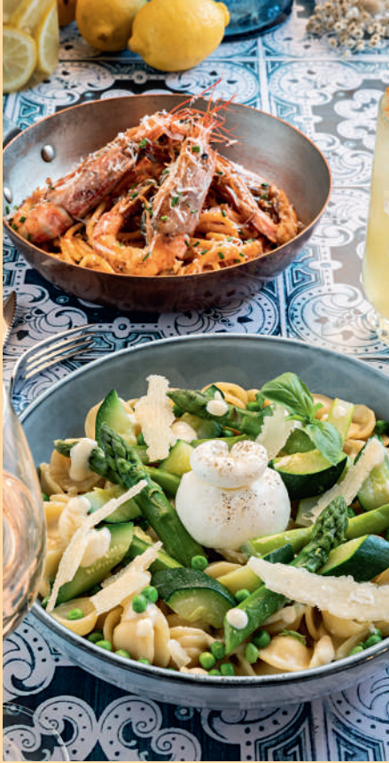
Orecchiette Primavera / Spaghetti alla Diavola