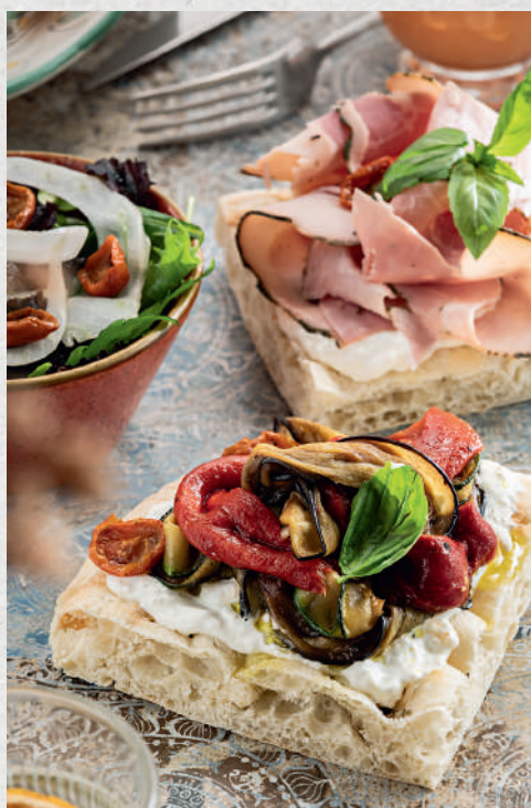
Verdure / Prosciutto & Stracciatella