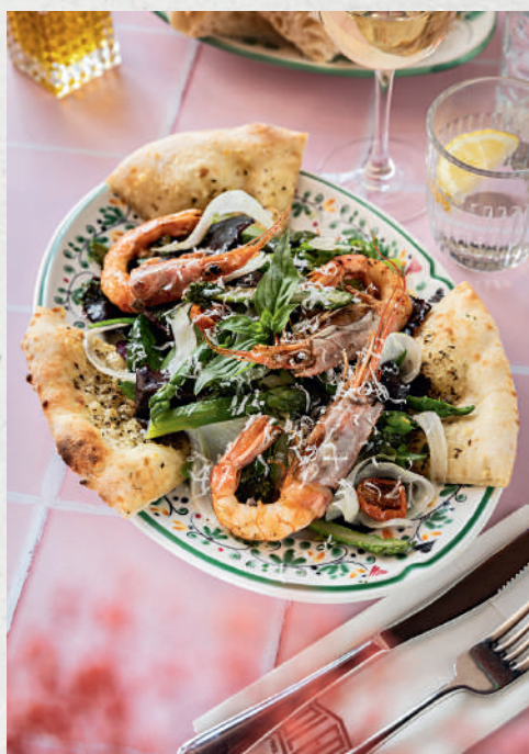
Gambas & asperge