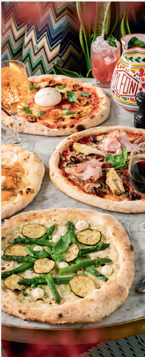
Asperge & Scamorza / Capricciosa / Bella Burrata / Salmone